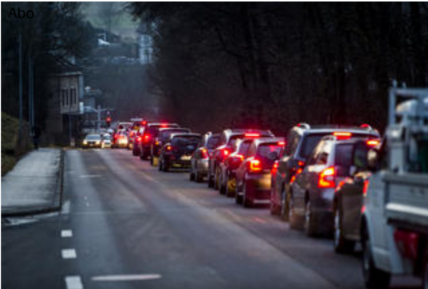
Hilft sie gegen das Verkehrschaos?